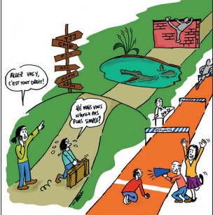
Prévenir les ruptures dans les parcours en protection de l'enfance Antoine Dulin