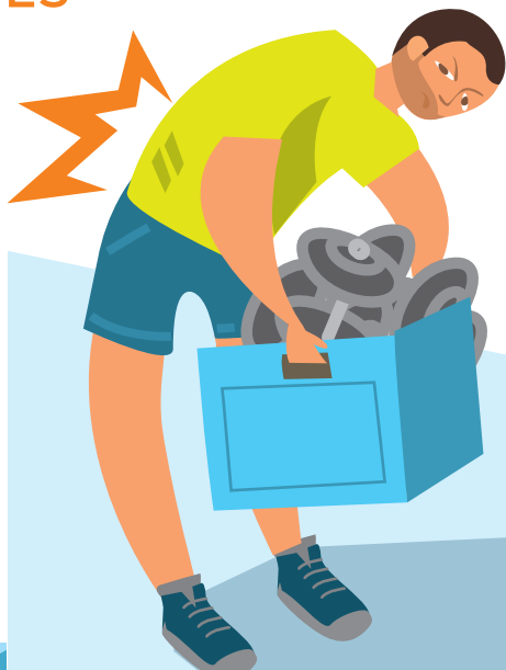
DOULEURS AU DOS