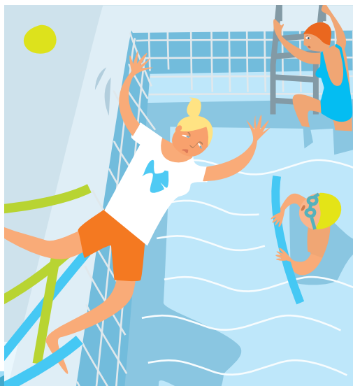
CHUTES, GLISSADES, TRÉBUCHEMENTS